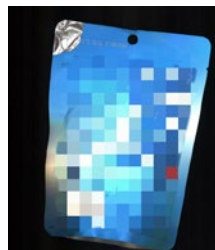
袋装产品中表面破损视觉图像