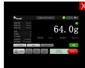
产品重量界面图像