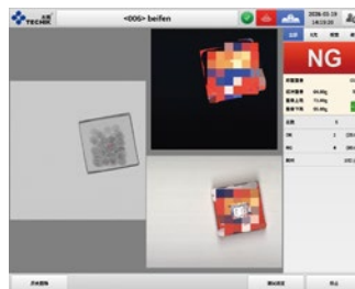
被测产品X射线、视觉、称重一体界面图像