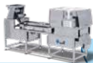
智能履带视觉分选机